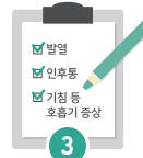
3 대상자, 보호자는 코로나19 증상이 있을 시 내원 전 알리기